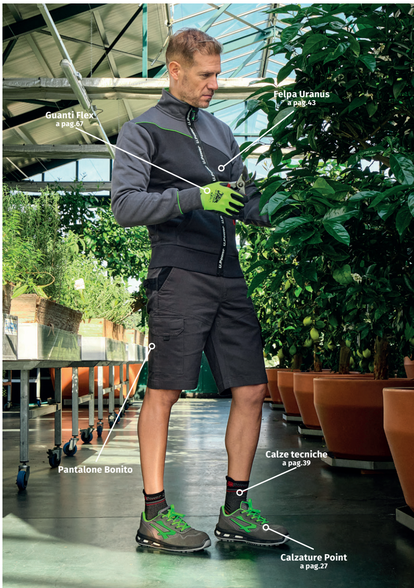
Guanti Flex a pag.67